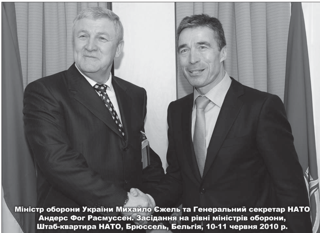
Міністр оборони України Михайло Єжель та Генеральний секретар НАТО Андерс Фог Расмуссен. Засідання на рівні міністрів оборони, Штаб-квартира НАТО, Брюссель, Бельгія, 10-11 червня 2010 р.

Цей перелік містить практичні можливості щодо різноманітних форм і змісту проведення заходів, присвячених Дню євроатлантичного партнерства. Зокрема, постає питання розроблення відповідної комунікаційної стратегії і Плану спільних дій на виконання зазначених в Річній Національній програмі завдань. Для цього має бути якомога повно враховано власний український досвід проведення в рамках Дня євроатлантичного партнерства міжнародних щорічних конкурсів «Аліанте» і «Безпечна Україна. Безпечна Європа. Безпечний світ» для студентів і учнів старших класів навчальних закладів, а також діяльність «Євроклубів» і Центрив євроатлантичної інформації на базі навчальних закладів, дебати, тренінги, фотовиставки і публікації із зазначених питань.