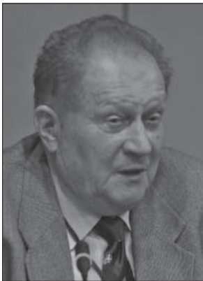
Вадим Гречанинов, генерал-майор, президент Атлантичної ради України, кандидат військових наук, доцент

Згадані менш відомі аспекти альянсу та співпраці між Україною і НАТО, на мою думку, мають стати більш видимими для ока громадськості. Це не тільки сприятиме кращому розумінню діяльності НАТО і наших відносин, а й допоможе змінити усталені погляди, розвіяти застарілі міфи та стереотипи, які все ще живі в українському суспільстві.